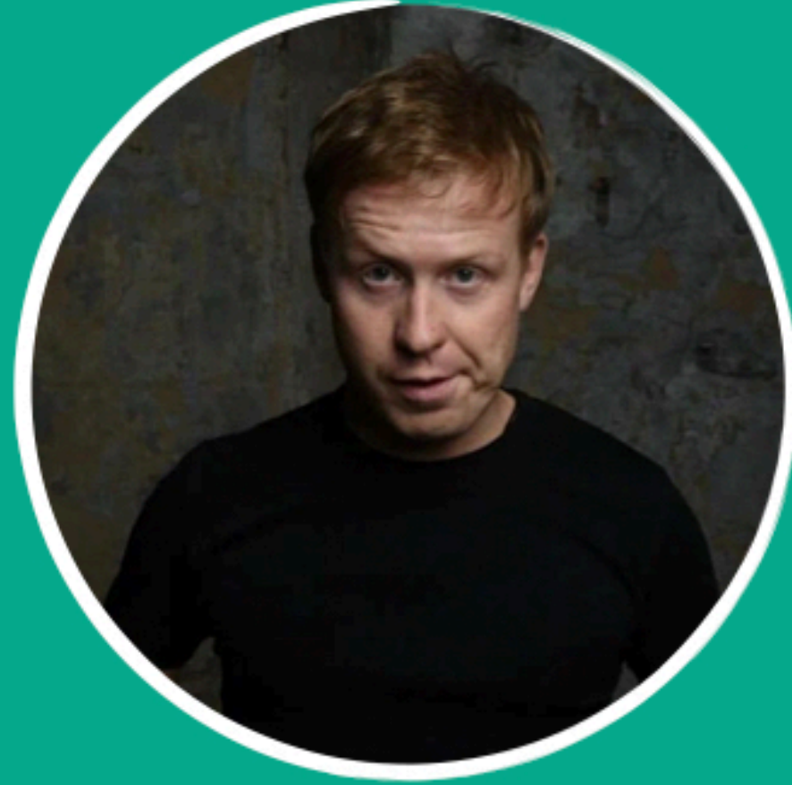
АНТОН БОГДАНОВ «ОГОНЬ», «Т-34», «ЕЛКИ»