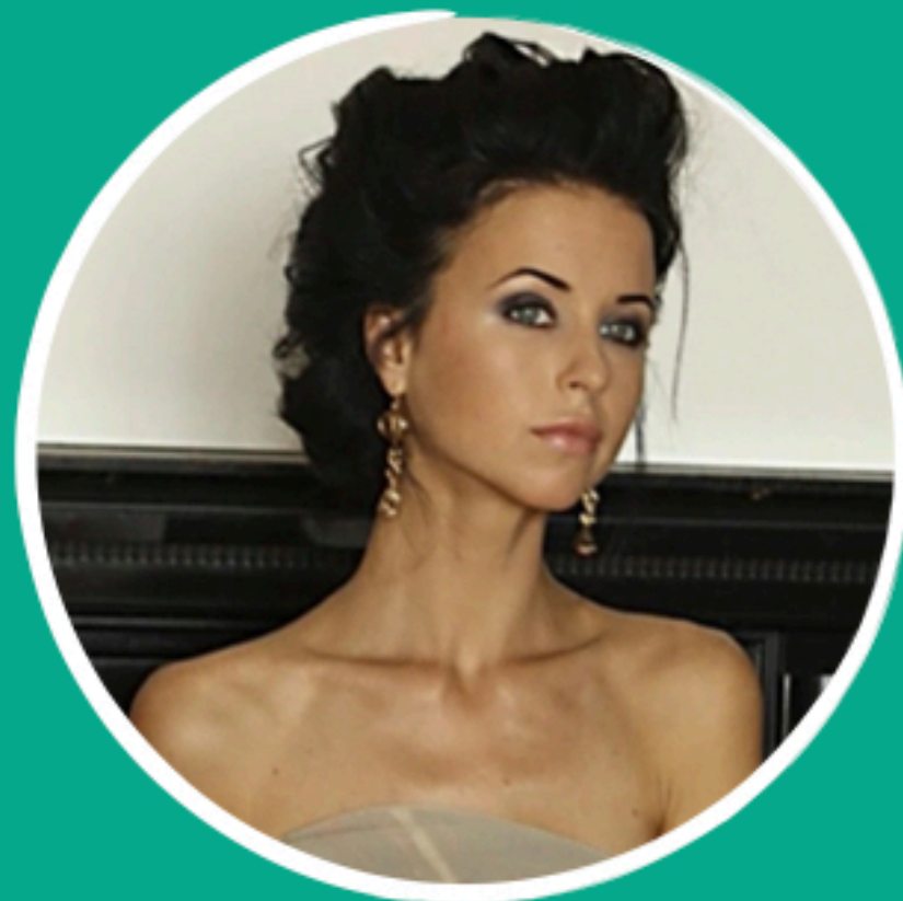
МИРОСЛАВА КАРПОВИЧ «КОРПОРАТИВ», «ПАПИНЫ ДОЧКИ»