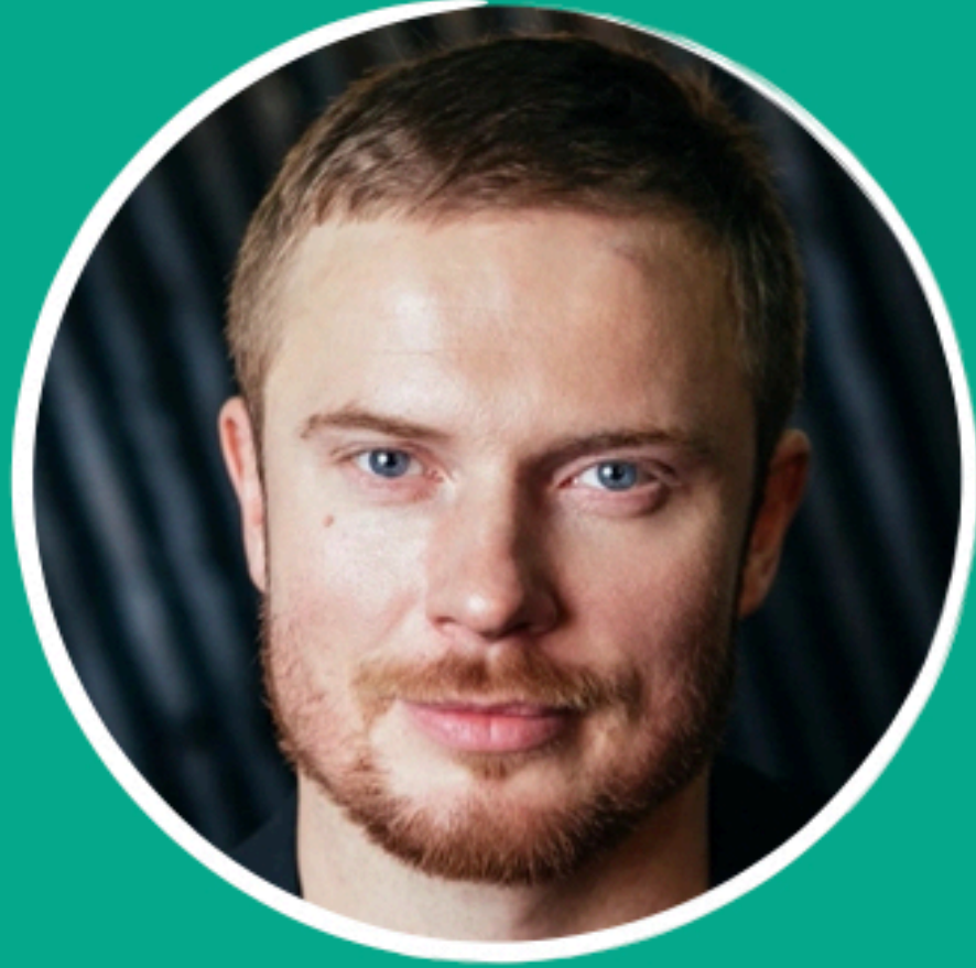
АНТОН ПАМПУШНЫЙ «БАЛКАНСКИЙ РУБЕЖ», «КОМА»