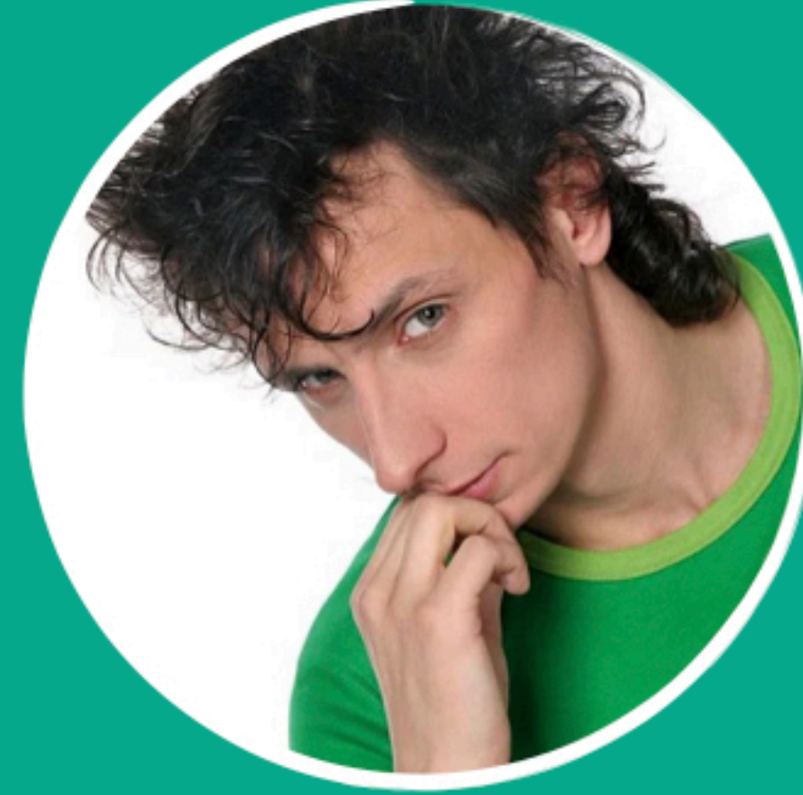
ВАДИМ ГАЛЫГИН COMEDY CLUB